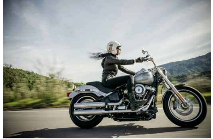
Nach der Winterpause sollte Mann oder Frau nicht ohne Vorbereitung in den Sattel steigen.

Ab in die Werkstatt zum großen Service? Das kann insbesondere für angetriebene Zweiräder sinnvoll sein, also Motorrad und E-Bike. Dabei wird geprüft, dass sämtliche Komponenten intakt sind und alle Funktionen zur Verfügung stehen. Auch Verschleißteile werden kontrolliert und bei Bedarf ausgetauscht. Ob Zweirad mit oder ohne Motor: Wichtig ist eine rechtzeitige Terminvereinbarung – denn im Frühling ist die Nachfrage nach Wartungen groß. Auch wer noch im Spätherbst oder Winter sein Zweirad technisch umfassend in Schuss gebracht hat, nimmt vor der ersten Ausfahrt eine Kontrolle wichtiger Komponenten vor: Ist der Reifendruck in Ordnung? Funktionieren Licht und Bremsen? Muss etwa die Kette gefettet werden? Wichtig bei moderneren Motorrädern ist auch der Blick auf die Bordelektronik: Ist die Software auf dem aktuellen Stand? Gleiches gilt für E-Bikes. Hier kann man bei vielen Typen das Update komfortabel per App selbst vornehmen.