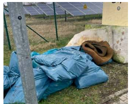
Arbeitseinsatz 2023

Weitere aktuelle Informationen gibt es auch auf der Homepage Ihrer Gemeinde: www.borsdorf-sachsen.de