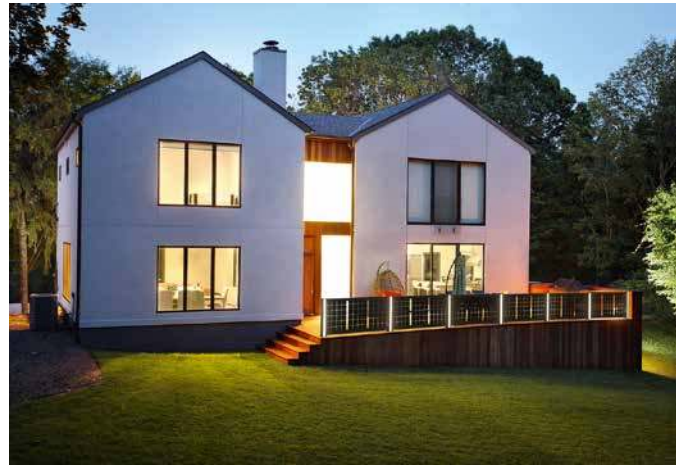
Nicht nur am Balkon, auch als Zaunverkleidung machen die Solarelemente eine gute Figur – und sorgen gleichzeitig für mehr Energie-Unabhängigkeit.