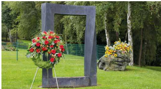
Tor zwischen den Welten.