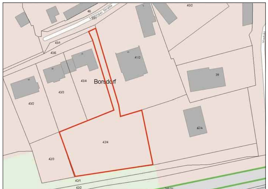
Räumlicher Geltungsbereich (Auszug aus RAPIS, Raumplanungsinformationssystem Bauleitplanung 08/2023)