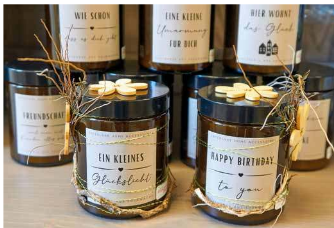
Entzückende Geschenke, die lange Freude bereiten: vegane Duftkerzen mit bis zu 40 Stunden Brenndauer.