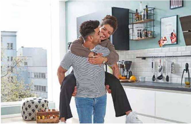
Gut geplant und nach dem eigenen Geschmack eingerichtet wird die erste eigene Küche zum Wohlfühlort.

Gerade bei kleinen Räumen und wenig Budget ist gute Planung wichtig