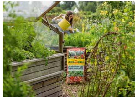
Eine hochwertige Pflanzerde in Bio-Qualität trägt zum erfolgreichen Start der neuen Gemüsesaison bei.