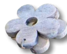
Entdecken Sie den zauberhaften Luxus handgegener Duftkerzen, hergestellt in Deutschland.