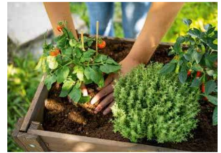
Als oberste Schicht ermöglicht die Hochbeeterde ein gesundes Gedeihen der Pflanzen. Da die Füllung mit der Zeit zusammensackt, sollte sie bei Bedarf zum Frühjahr aufgefüllt werden.

Vielen Freizeitgärtnern ist die Wachstums- und Erntesaison in der heimischen Region deutlich zu kurz. Für Abhilfe kann ein abgedecktes Hochbeet sorgen: Auf diese Weise beginnt die Pflanzperiode bereits im Februar und kann bis weit in den November hinein andauern. Abhängig vom individuellen Pflanzplan eignen sich sonnige bis halbschattige Standorte.