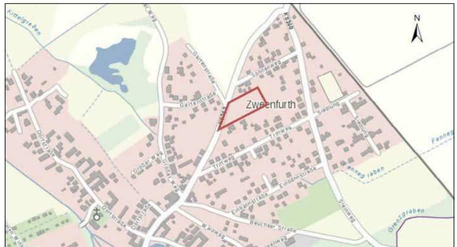
räumlicher Geltungsbereich des Bebauungsplans (Auszug aus RAPIS)