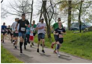
Auf der Strecke