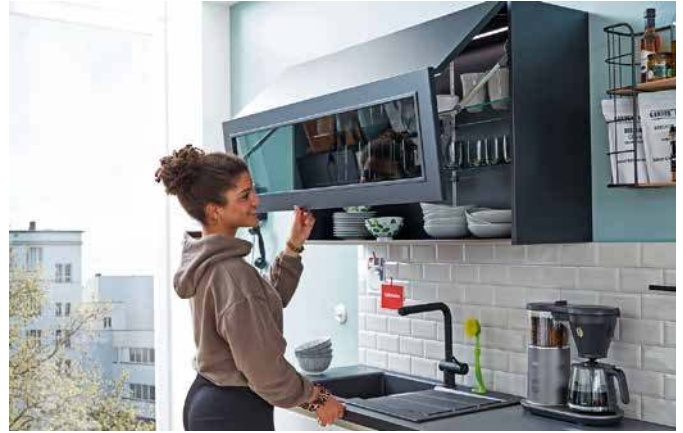
Hängeschränke vergrößern den verfügbaren Platz und können auch optisch ein Gewinn sein.

Die fängt mit der Küchenform an: „Eine Küchenzeile passt in jeden Raum“, weiß Marko Steinmeier, Geschäftsführer von KüchenTreff, einer Einkaufsgemeinschaft von mehr als 500 inhabergeführten Küchenstudios und Fachmärkten in Deutschland und Europa. „Darin lässt sich alles, was man braucht, gut integrieren.“ Basics sind hier Kochfeld, Backofen, Kühlschrank und Spüle, dazu ausreichend Stauraum für Geschirr und Kochutensilien. Bei größeren Küchenformen – etwa der L- oder U-Form, einer zweizeiligen Küche oder einer mit Kochinsel – sollte auf das sogenannte „Arbeitsdreieck“ geachtet werden. „Damit ist eine geschickte Anordnung von Spüle, Herd und Kühlschrank gemeint, denn zwischen diesen Punkten bewegt man sich viel hin und her, sodass kurze Wege wichtig sind“,