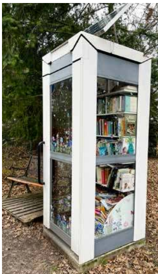
Bücherzelle in Zweenfurth

JA hieß die einhellige Antwort in einer geselligen Runde der Nachbarschaft am Rande der Panitzscher Rennbahn. Was ist eine Bücherzelle? In ihr kann man spannende ausgelesene Bücher tauschen gegen Bücher, die jemand anderes weitergeben wollte.