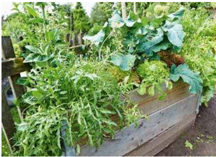
Starkes Wachstum: Hochbeete versprechen eine reiche Ernte über viele Monate hinweg.

So lässt sich die Pflanzperiode im heimischen Garten deutlich verlängern