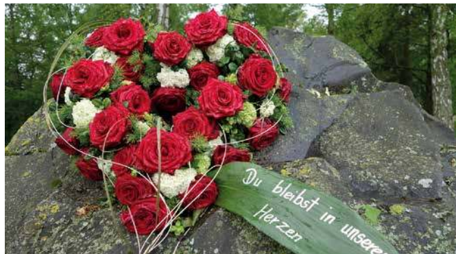
Gedenken Blumenherz.

Früher waren Krankheit, Sterben und Tod in der Großfamilie unter einem Dach vereint, genauso wie Romanze, Heirat und Geburt. Heute haben viele Menschen nie lernen und auch nie erfahren können, was Sterben und Tod bedeuten und wie sie von einem geliebten Menschen Abschied nehmen und richtig trauern können. Hinzu kommt, dass viele Angehörige nicht mehr an einem einzigen Ort leben und kaum einen Bezug zum örtlichen Friedhof haben. Mit der Trauer kommt die schmerzliche Erkenntnis der Endlichkeit. Die Einsicht reift, dass ein Part-